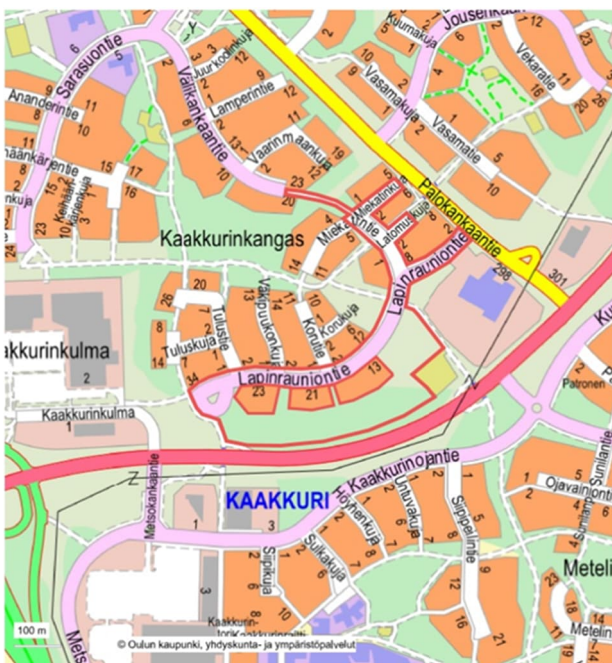
Kuva 1. Suunnittelualue opaskartalla

Suunnittelualueen kaduilla on päällyste- ja routavaurioita ja alueen vesihuoltoverkosto on saneerauksen tarpeessa.