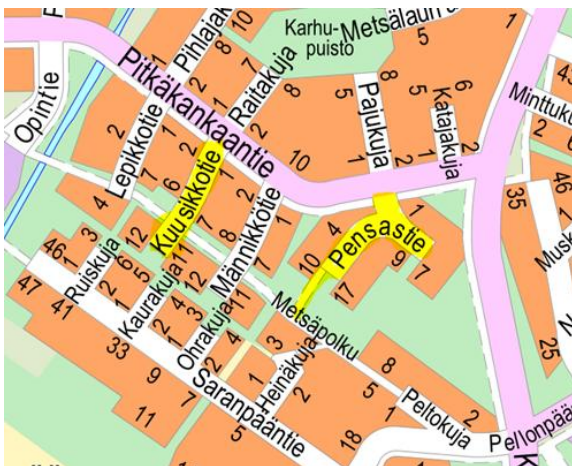
Kuva 1. Suunnittelualue opaskartalla

Pensastiellä suunnittelualue rajautuu kaavanmukaisten katualuerajojen lisäksi etelässä Metsäpolun, pohjoisessa Pitkäkankaantien nykyisiin jalankulku- ja polkupyöräväyliin. Pensastieltä Metsäpolulle johtava nykyinen jalankulku- ja polkupyöräväylä on suunniteltu parannettavaksi nykyiselle paikalleen.