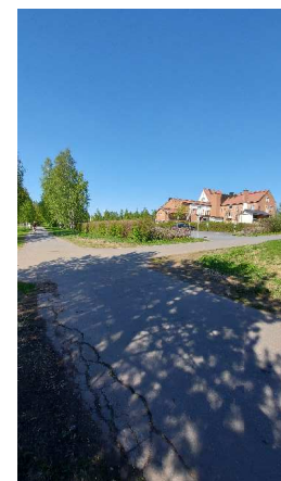
Kuva 5. Hintan seurakuntatalo sijaitsee kulmittain alueeseen.