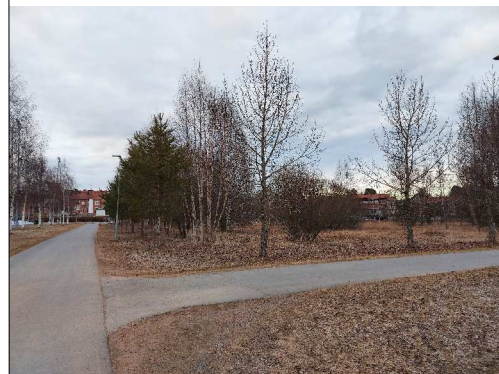
Kuva 1. Näkymä alueen läpi keväällä lounaasta kohti koillista. Kevytliikenneväylän varren istutettu puusto rajaa aluetta.

Alueella ei ole erityisiä maisemallisia ja luontoympäristön arvoja. Avoimen alueen yksittäisiä puita voi mahdollisuuksien mukaan säilyttää rakennettavan alueen viheralueilla. Alueen jatkosuunnittelussa tulee ottaa huomioon, millaiset näkymät muodostuvat aluetta ympäröiville väylille ja virkistysalueille.