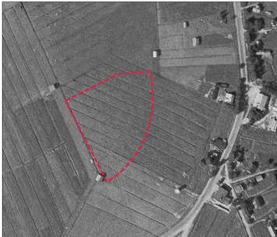
Selvitysalue rajattuna vuoden 1939 ilmakuvalla.