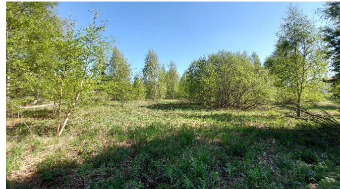
Kuva 2. Selvitysalueen keskiosat ovat säilyneet suhteellisen avoimena, niittymäisenä alueena.