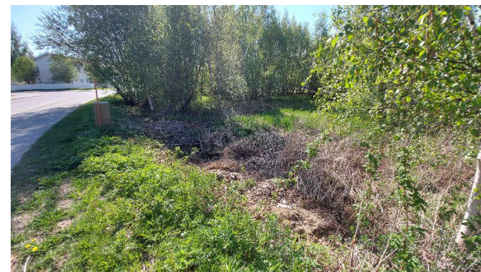
Kuva 6. Hoitamaton ja käyttämätön alue asutun alueen vieressä houkuttelee puutarhajätteen läjitykseen. Mäkituvantien varteen on kertynyt puutarhajätettä.