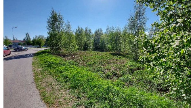
Kuva 3. Näkymä Mäkituvantien suuntaisesti. Tiheä puusto alueen reunoilla katkaisee näkymät kesäaikaan.