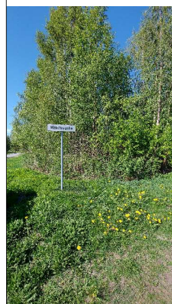
Kuva 4. Tiheää puustoa alueen länsireunalla