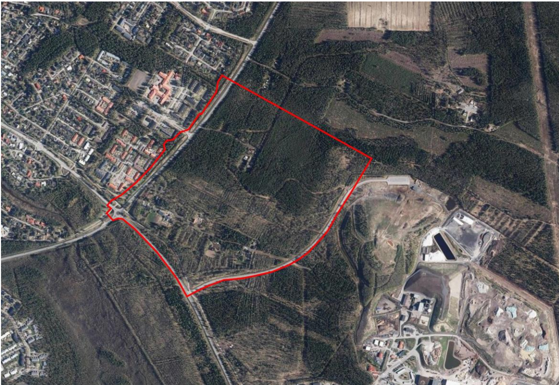
Kuva 2. Ilmakuvaan on rajattu punaisella alue, jolle suunnitellaan uutta asemakaavaa.

Asemakaavan tavoitteena on suunnitella alueen maankäyttöä Uuden Oulun yleiskaavan periaatteiden mukaisesti. Alueelle tavoitellaan monipuolista tonttitarjontaa pientalovaltaiselle asumiselle. Alueelle voi sijoittua omakotitaloja, kytkettyjä pientaloja, rivitaloja ja pienkerrostaloja. Lisäksi alueelle voi sijoittua jonkin verran palvelu- ja työpaikkarakentamista liittyen esimerkiksi urheilu- ja virkistyspalveluihin. Alueelle suunnitellaan toimiva ja tehokas katuverkko, sekä kehitetään alueen viheryhteyksiä ja virkistysmahdollisuuksia huomioiden alueen olevat ja tulevat ulkoilureitit sekä alueen luonto- ja maisema-arvot.