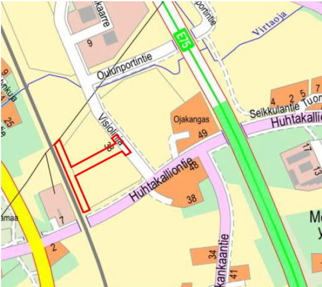
Kuva 1. Suunnittelualan rajaus opaskartalla