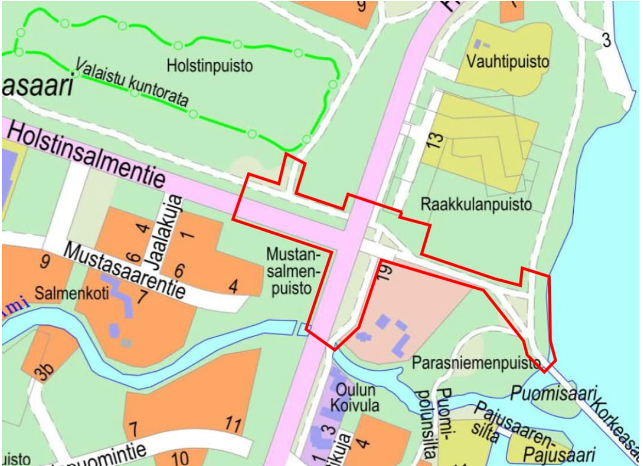
Kuva 1. Suunnittelualan rajausta opaskartalla