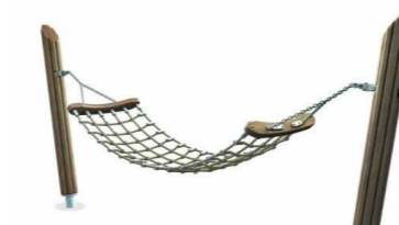
11. MP0202 Muumiriippukeinu yli 2v