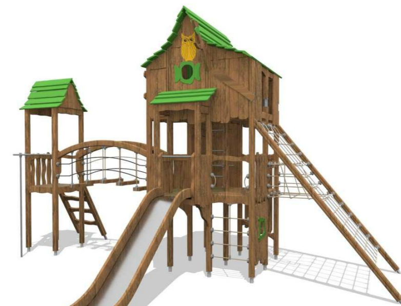
2. Kiipeilykeskus Q16232 Owl Valley yli 3v