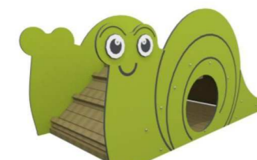
7. Q15078 Etanaliuku yli 1v