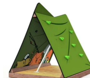
9. MP0203 Nuuskamuikkusen telttä yli 1v