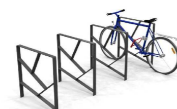
14. Pyöräteline runkolukittava Alushell Branch