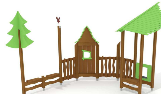
4. Q16231 Leikkitalo ja fasadi yli 1v