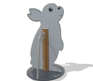
3. Jousikeinu Q16227 Rabbit Carousel Flora F211 yli 3v