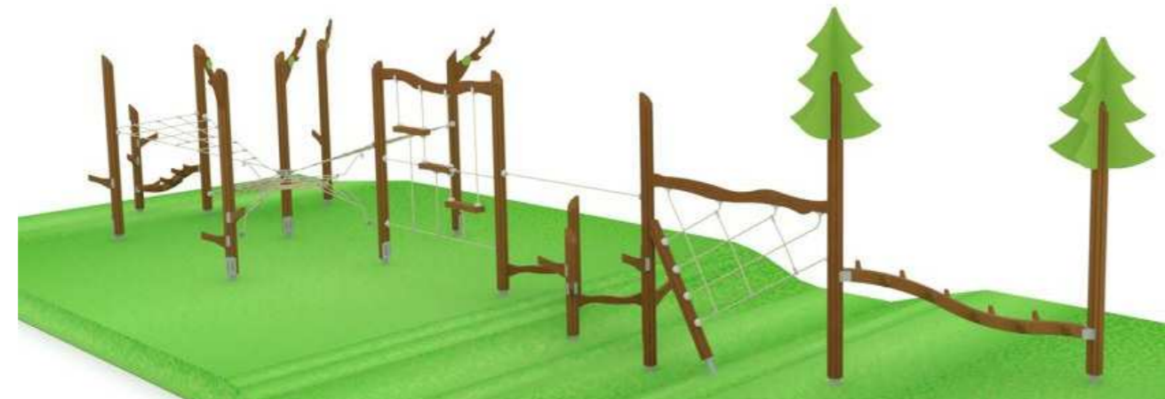
12. Kiipeilyrata Q16230 yli 5v