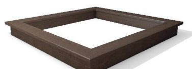
5. Hiekkalaatikko SR300300 yli 1v