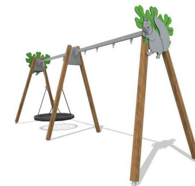
1. Keinuteline Q16228_Squirrel swing Lautakeinu 2:lle yli 3v. Linnunpesäkeinu yli 1v