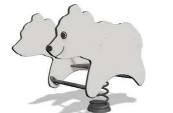
10. Q07149 Jousikeinu karhu yli 1v