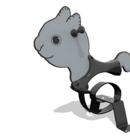
6. Jousikeinu Q16226 Baby Squirrel yli 3v