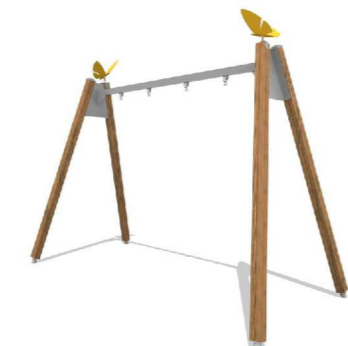
8. Keinuteline Q16229 Butterfly Flora I1 2 turvaistuinta yli 1v