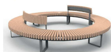
13. Penkki Sineu Graff Affinite Ø 3 m