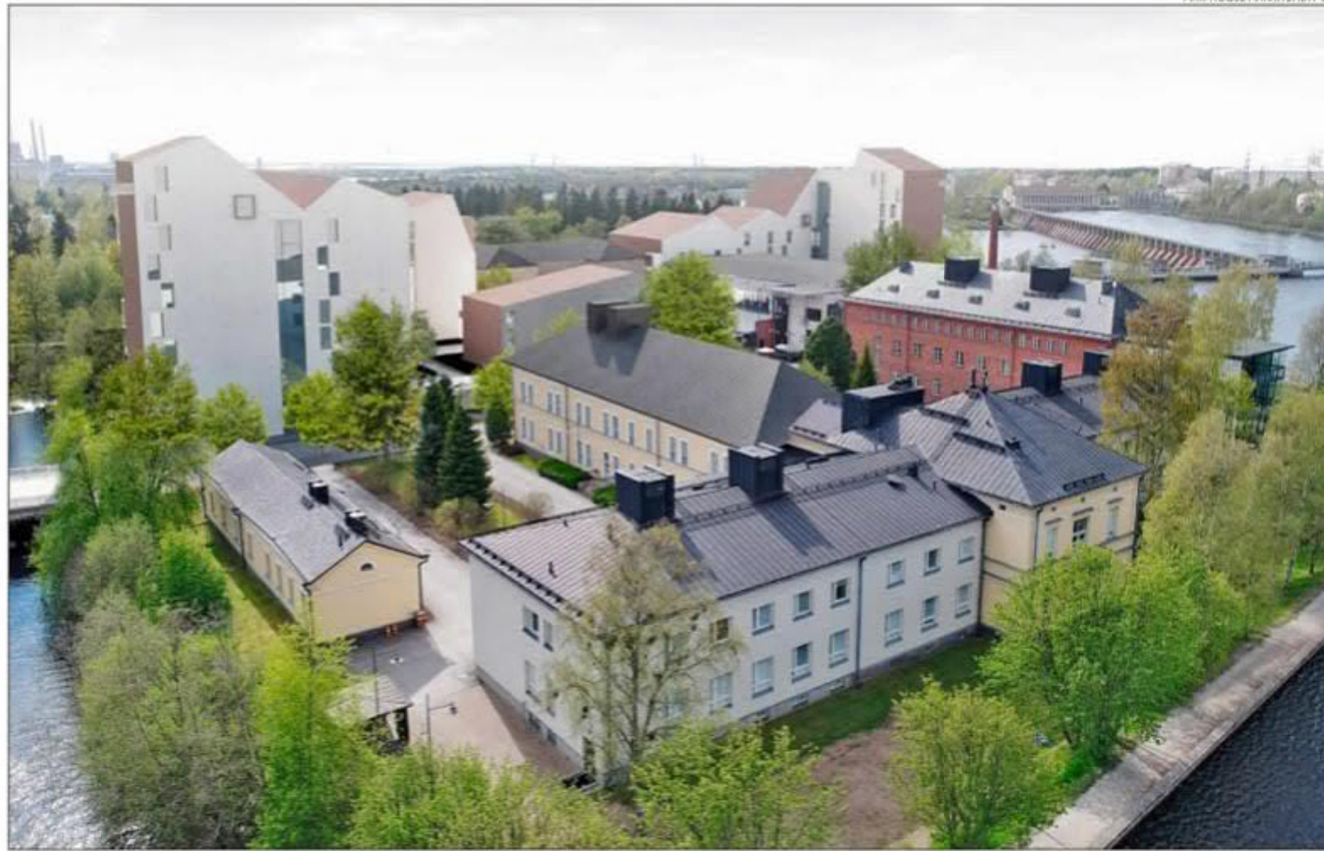
ARK-HOUSE ARKKITEHDIT OY