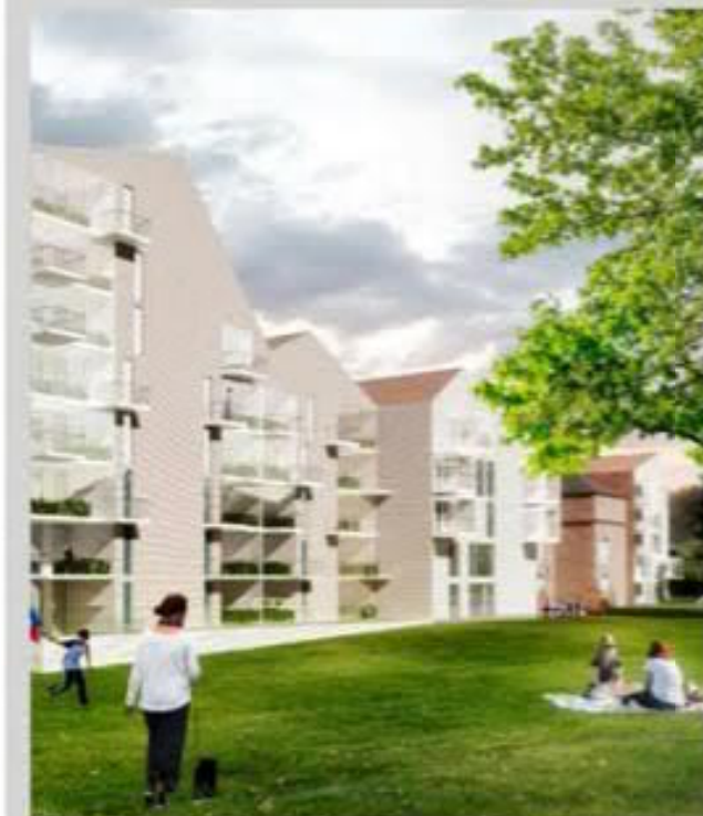
Uusi rakennuskanta terävöittää reunaviivaa Ainolan puiston ja Hupisaarten puistoalueen suuntaan.

(Tiivistys kilpailuehdotuksen tekijöiden perusteista)