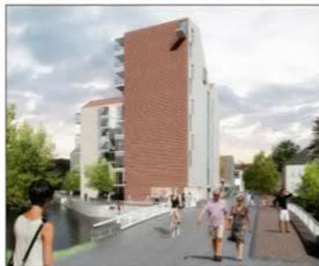
Uusi rakennuskanta asetettu kehittämään korttelia.