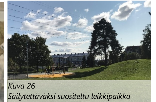
Kuva 26 Säilytettäväksi suositeltu leikkipaikka