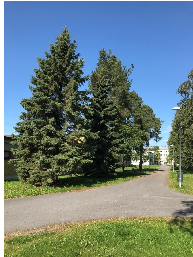
Kuva 12 Näkyä Välipolulta Valtatietä kohti.

Päiväkodin pihalla on leikkivälineiden lisäksi isoja koivuja ja mäntyjä sekä huolellisesti leikattuja taikinamarjapensaita. Eteläpuolella pihaa aidan vieressä kasvaa syreeniä. Pihalla on myös muutamia koristeomenapuita sekä mustaherukkapensas. Kytöntien puolella on hyvässä kasvussa olevat vaahterat.