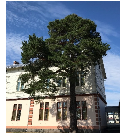
Kuva 27 Säilytettävä mänty Koskitiellä