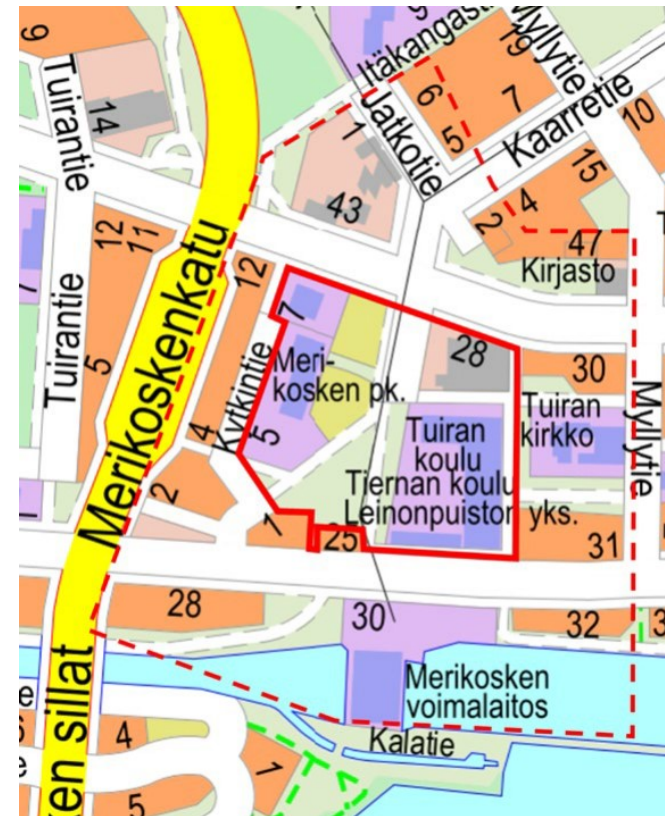
Kuva 1 Tarkasteltu alue kartassa yhtenäisellä, punaisella viivalla. Punainen katkoviiva on asemakaavamuutoksen lähialue, jolle hankkeella voi olla vaikutuksia.

Vanhoista kartoista nähdään, että tarkastellulla alueella on ollut vuonna 1953 vanhan koulurakennuksen lisäksi muutamia pienempiä taloja. Tuiran alueella on toiminut sairaala, ollut asutusta ja havupuuvältaista metsää tarkastelualueen länsi- ja pohjoispuolella kartassa näkyvällä alueella. Vuoden 1965 kartasta voi huomata, että lähialueella pienemmät talot ovat korvautuneet isommilla ja teiden linjaukset ovat muuttuneet. Mainitut viheralueet ovat tässä vaiheessa vielä säilyneet. Vuonna 1989 tieverkosto on ympäröivällä alueella tiivistynyt, pohjoispuolen viheralue on hävinnyt ja tarkastelualueelle on rakennettu lisää taloja.