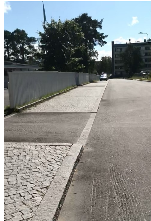
Kuva 22 Näkymä Kytkintietä pitkin etelään. Vasemmalla näkyvissä päiväkodin pihalla kasvavia puita.