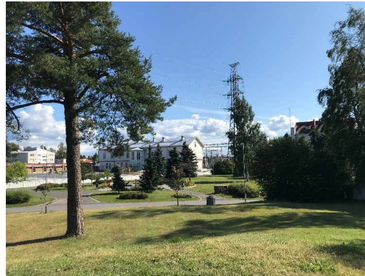
Kuva 19 Näkymä mäen päältä koulua kohti. Edessä vasemmalla vanha mänty. Voimalinja näkyy taustalla.

Alueen eteläpuolen maisemassa hallitsevana on vanha koulurakennus ja suuri mänty. Länsipuolen seinäkin on saanut graffitin kylkeensä. Alueen sisääntulon maisemaa koulun länsipuolelta hallitsee voimalinja pylväineen.