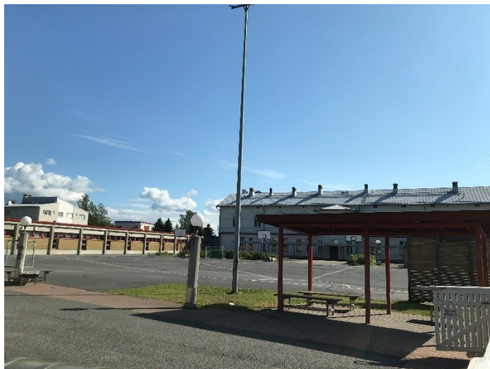
Kuva 15 Pelivälineitä, katos ja pensasalueita koulun avaralla pihalla. Taustalla koulun vanhempi osa ja vasemmalla matalampi uudempi osa.