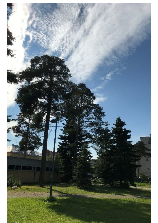
Kuva 25 Havupuita puiston etelälaidassa