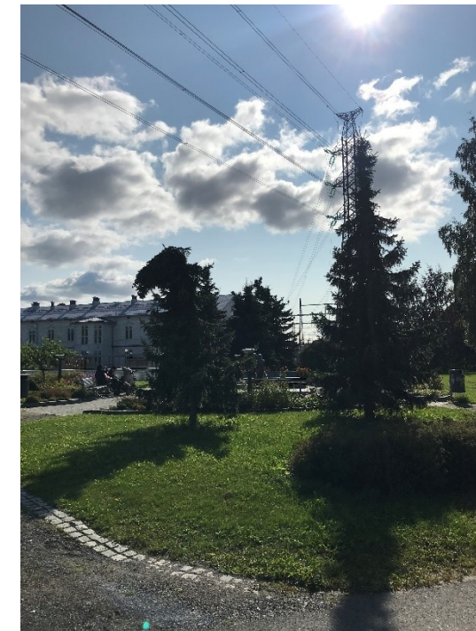
Kuva 24 Puiston okakuusia, joista vasemmalla voimakkaasti taipunut latva. Takana vanha koulurakennus. Voimalinja on vahvasti maisemassa mukana.