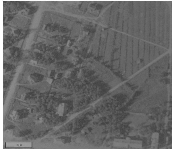
Kuva 6 Ilmakuva vuodelta 1931. Alalaidassa oikealla erottuu vanha koulu.

Vuodesta 2014 tähän päivään mennessä suurin muutos on tapahtunut marketin ympäristössä. Paikotus on siirtynyt pääosin parkkihalliin ja rakennus on korvattu uudella ja suuremmalla. Leikkipaikka on uusittu vuonna 2019.