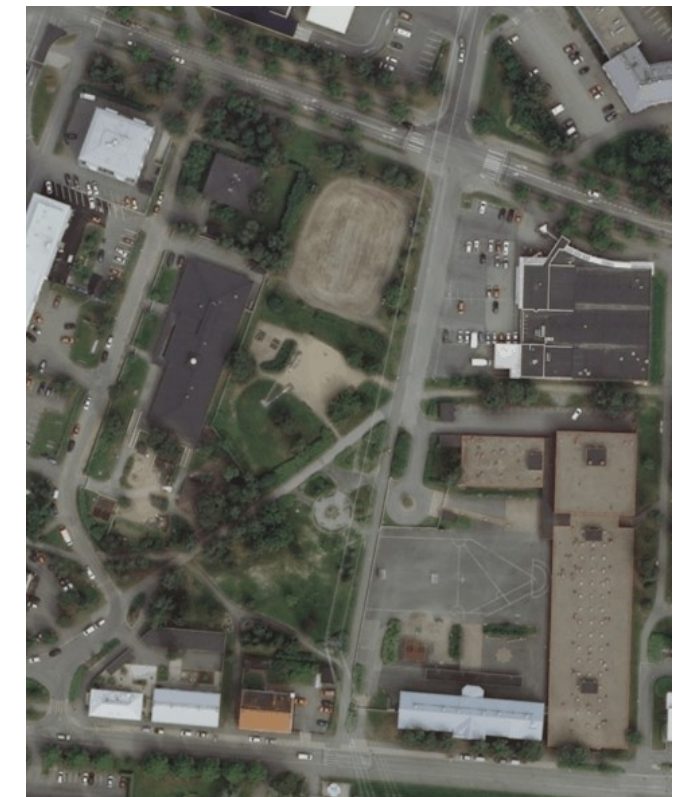
Kuva 11 Ilmakuva vuodelta 2014