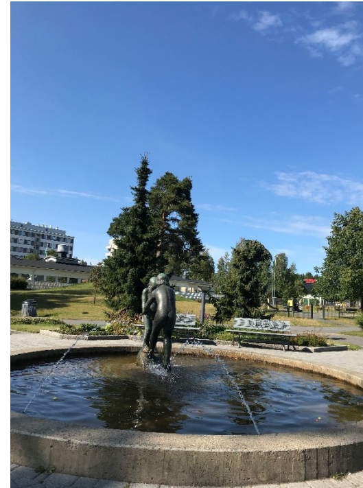
Kuva 23 Suihkulähde ja Sisarukset-patsas puiston keskellä. Takana näkyy leikkipuisto ja vasemmalla päiväkodin matala rakennus.