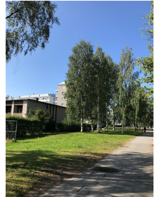
Kuva 14 Alueen pohjoislaidalla kasvavat koivut.