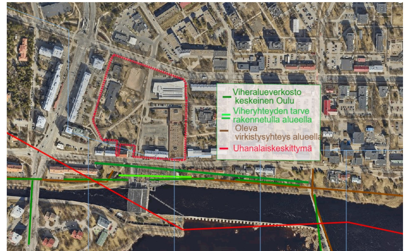
Kuva 2 VILMO-yhteydet punaisella katkoviivalla rajatun asemakaavan muutosalueen läheisyydessä. Tarkastellun alueen sisällä ei ole merkintöjä.