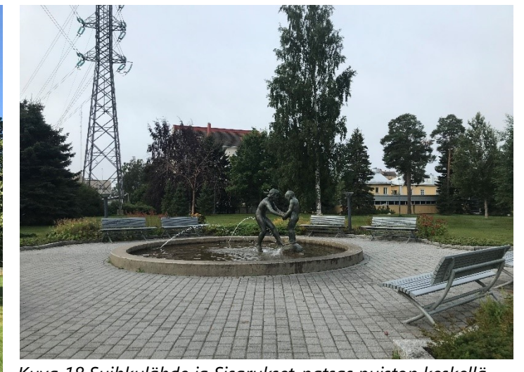
Kuva 18 Suihkulähde ja Sisarukset-patsas puiston keskellä. Kiveyksen reunalla monilajiset perennaistutukset ja graffitein sotketut penkit. Taustalla puiston puuryhmiä ja maisemassa hallitsevana näkyvä voimalinja pylväineen. Sittemmin kaadettu kuollut tuohituomi näkyy vielä kuvassa.