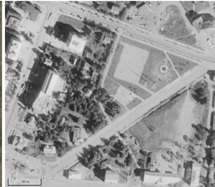
Kuva 7 Ilmakuva vuodelta 1961