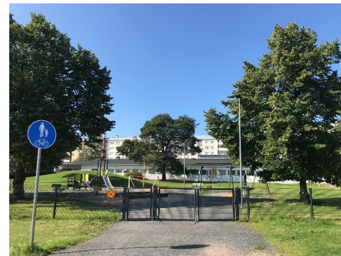
Kuva 17 Hiljattain kunnostettu leikkipuisto. Reunoilla kauniit lehmukset. Takana näkyy mäki ja komea mänty.