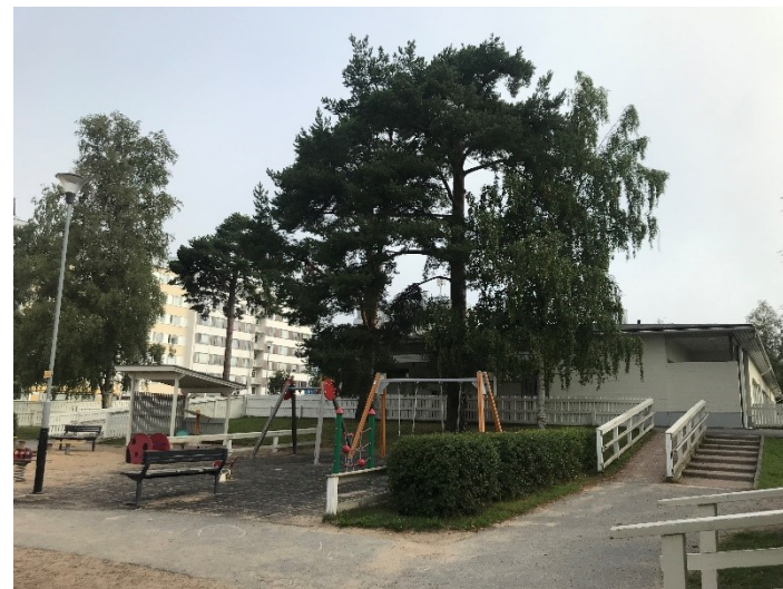
Kuva 16 Päiväkodin pihaa ja siististi leikatut pensasidat. Talon päädyssä hienot männyt ja kuvan vasemmalla laidassa Kytöntien vieressä kasvava suuret koivut.