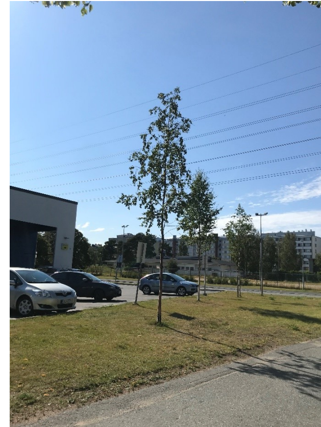
Kuva 13 Koivuja S-marketin edustalla Valtatien puolella.