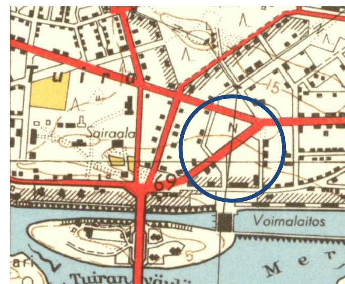
Kuva 3 Karttakuva vuodelta 1953. Tarkasteltu alue on sinisen ympyrän sisällä.