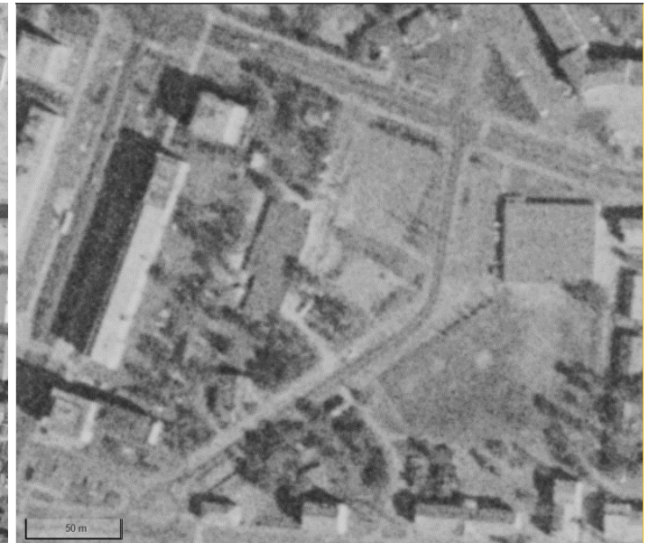
Kuva 8 Ilmakuva vuodelta 1971