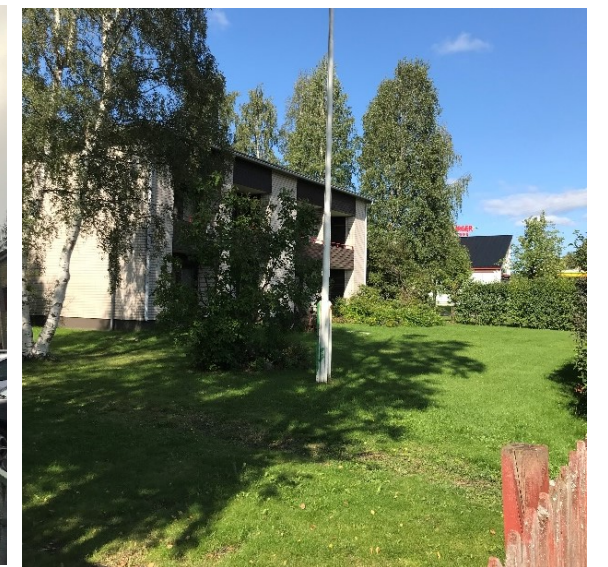
Kuva 21 Asuintalon takapiha.