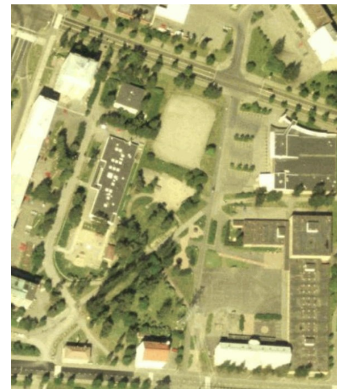
Kuva 10 Ilmakuva vuodelta 1999