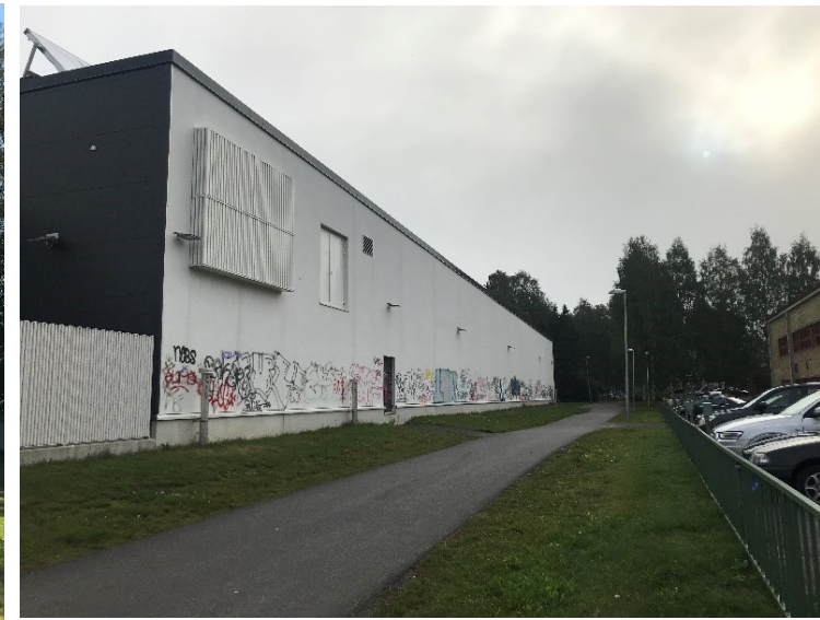
Kuva 20 S-marketin graffitipeitteinen seinä, kulkuväylä ja koulun pieni paikoitusalue.