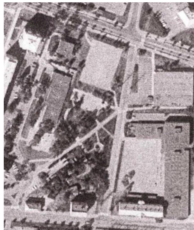
Kuva 9 Ilmakuva vuodelta 1980