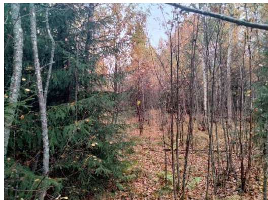
Kuva 2. Vanhaa peltoa kaavamuutosalueella