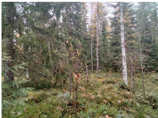
Kuva 1. Liito-oravalle sopivaa metsää alueella

Kaavamuutosalueen eteläosissa länsi-itäsuuntaisen ojan eteläpuolella ja ympäröivällä Piispanletonpuiston alueella on liito-oravan elinympäristöksi soveltuvaa tuoretta mustikkatyyppin kuusi-/sekametsää (Kuva 1, kuva 3). Lahopuun määrä vaihtelee ja kaavamuutosalueelle jäävällä kaistaleella sitä on hyvin vähän. Ojan pohjoispuolella kaavamuutosalue on vanhaa peltoa, jolla kasvaa pääasiassa nuoria ja kitukasvuisia lehtipuita, pääosin koivuja (Kuva 2). Seassa on muutamia yksittäisiä nuoria havupuita, pääosin kuusia. Alueen kaakkoisnurkassa ojan laidassa kasvaa muutamia nuoria haapoja, mutta liito-oravien suosimia isoja haapoja ei ole. Ojan pohjoispuolinen alue ei ole liito-oravalle sopivaa elinympäristöä. Kaavamuutosalueella ei havaittu viitteitä liito-oravan esiintymisestä.