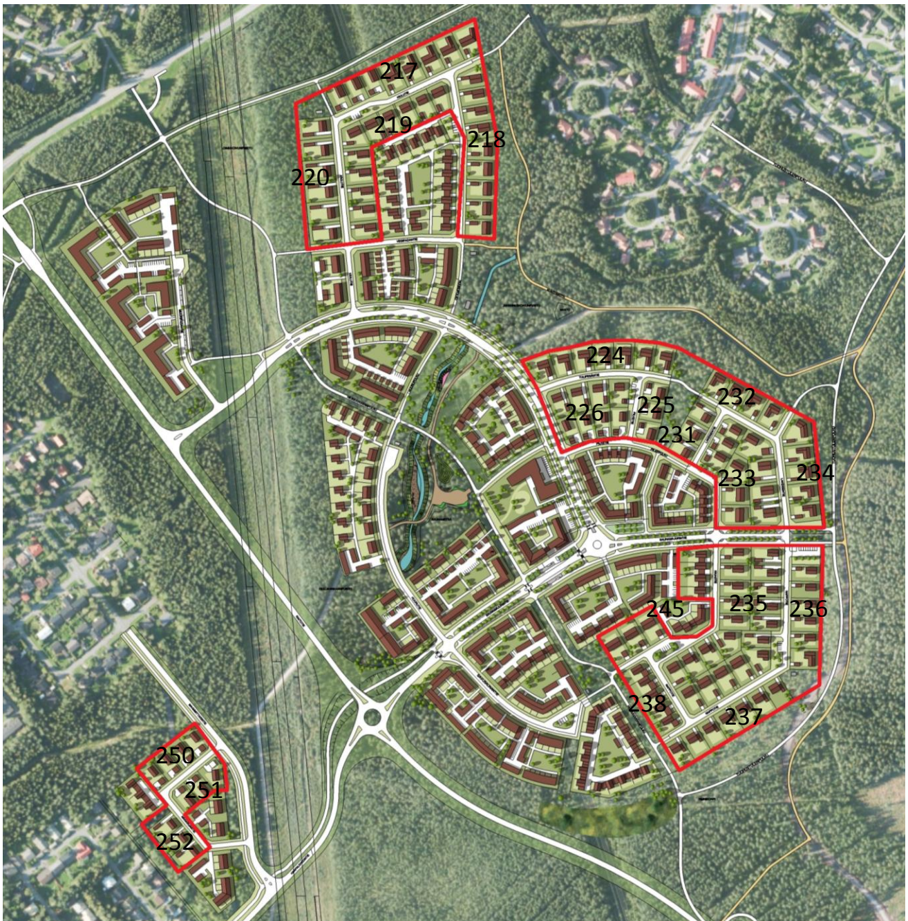
Kiulukankaan havainnekuva. Kuvaan on rajattu tontit, joita tämä rakentamistapaohje koskee.

Rakentamistapaohjeen tarkoituksena on ohjata rakentamista Kiulukankaan alueella siten, että alueesta muodostuisi kaupunkikuvallisesti korkeatasoinen, yhtenäinen ja viihtyisä asuinalue. Rakennustapaohjeet täydentävät asemakaavan määräyksiä ja merkintöjä. Ohje on Oulun kaupungin tontinluovutuksessa rakentajaa ja tontin haltijaa sitova.