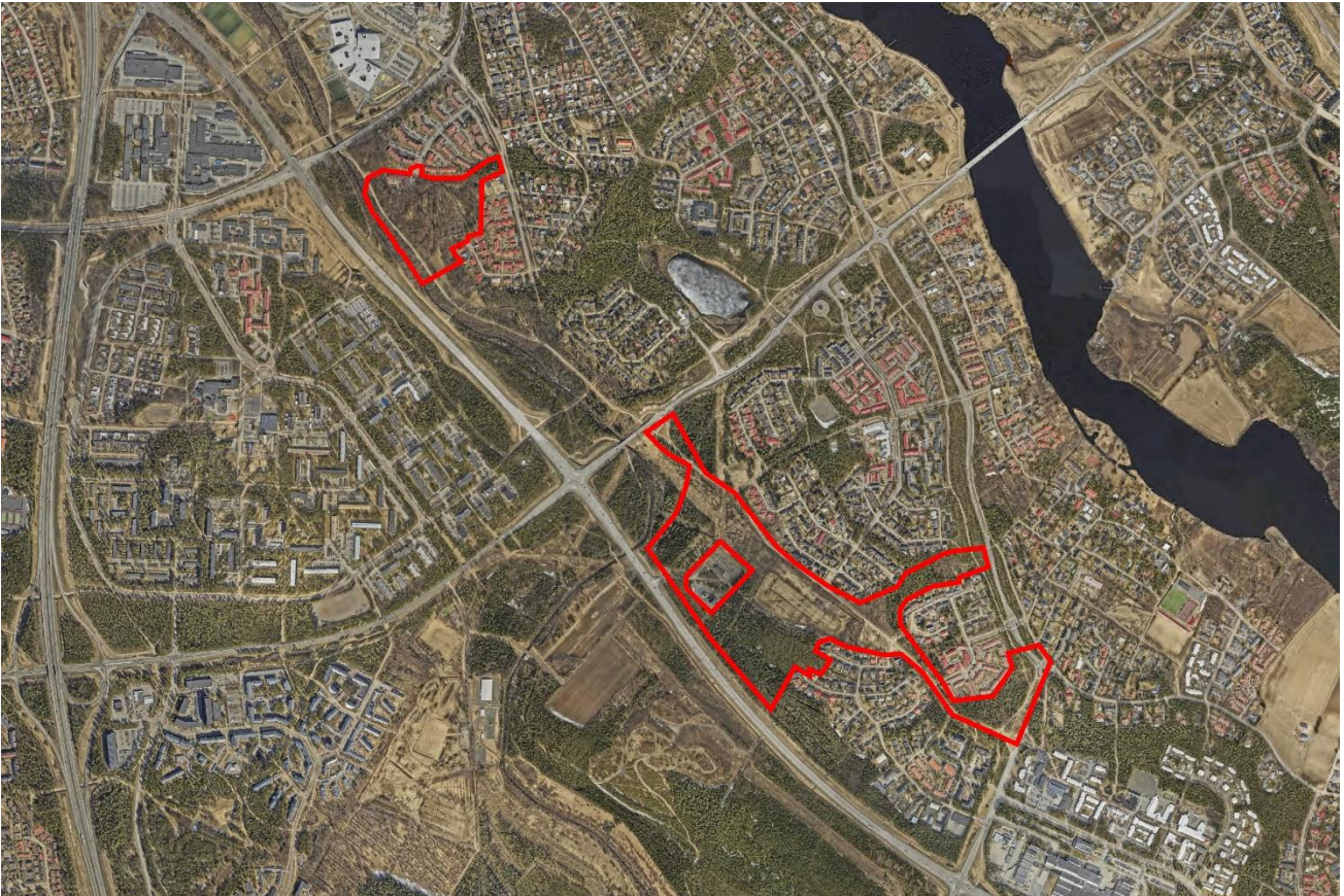
Kuva 2. Ilmakuvaan on rajattu punaisella Svaaninsuon, Ellinsuon ja Maikkulantien varren asemakaavan muutosalueet.

Maikkulantien varren kaavamuutosalueen pinta-ala on noin 4,3 ha. Alue on rakentamatonta metsäaluetta. Alueen pohjoisosassa metsä on nuorempaa umpeen kasvaneen kentän alueella. Lähiympäristössä on omakotitaloja, rivitaloja ja kerrostaloja. Maikkulantien varren asemakaavan muutoksen tavoitteena on alueen käyttötarkoituksen muuttaminen asuinrakentamisen korttelialueiksi sekä puistoalueeksi.