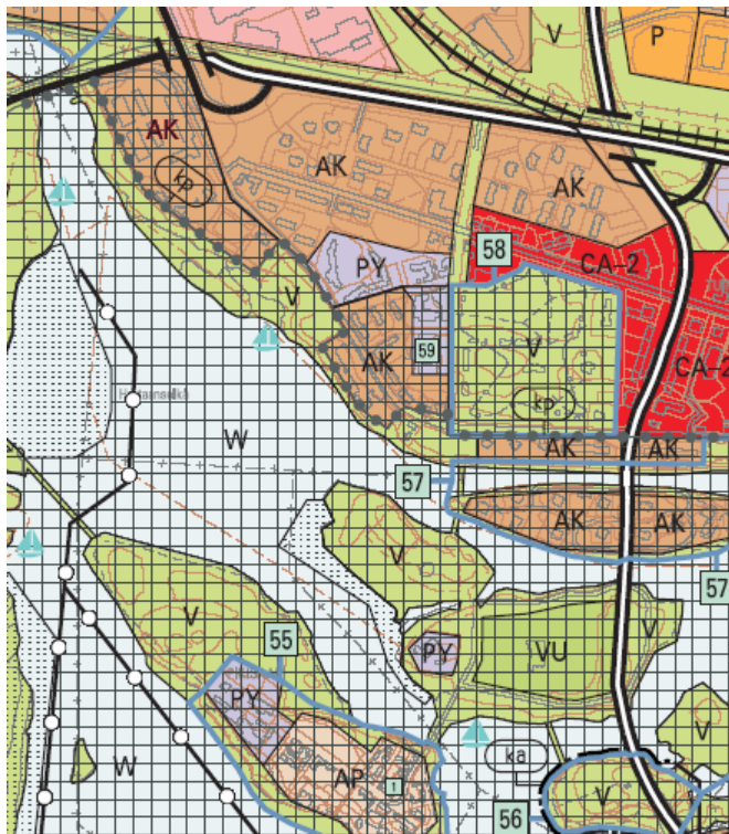
OTE YLEISKAAVASTA 2020