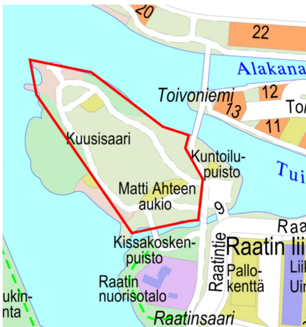
Kuva 1. Suunnittelualue opaskartalla

Kuusisaaren tapahtumapuisto on rakennettu vuonna 2017, keskeltä avoimeksi nurmikentäksi, jonka molempiin päihin on rakennettu suuret tapahtumakentät, jotka mahdollistavat joko esiintymislavarakennelmat tai pienempien tapahtumien järjestämisen kivituhka/asfalttipintaisella kentällä.