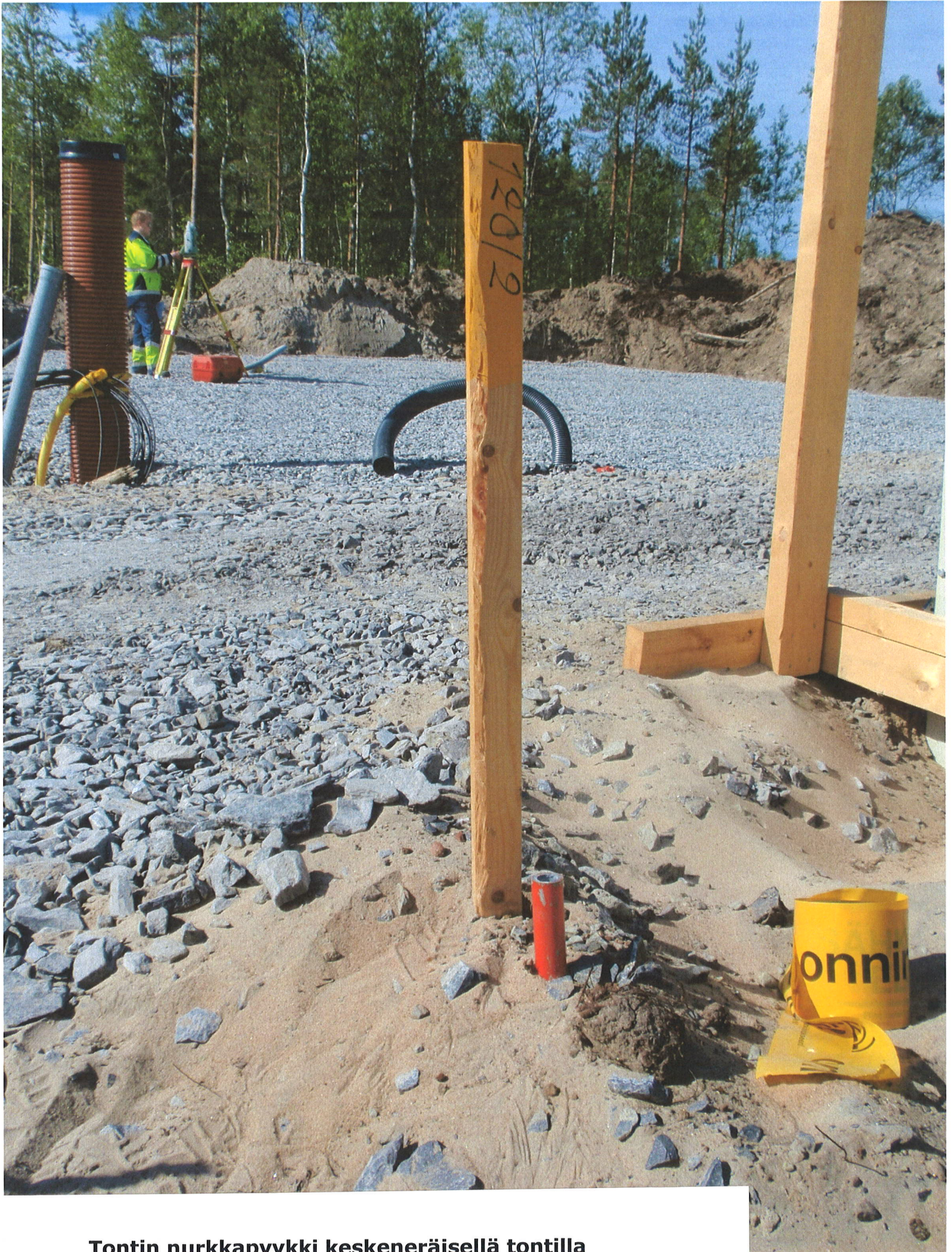
Tontin nurkkapyykki keskeneräisellä tontilla