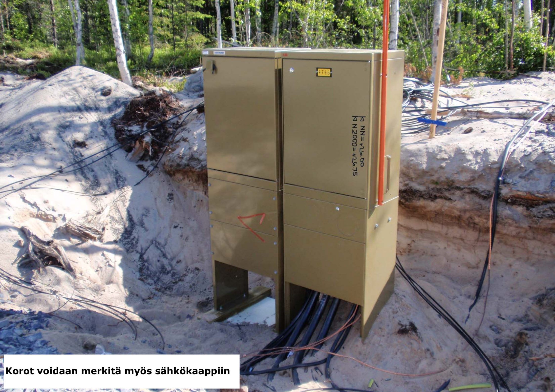
Korot voidaan merkitä myös sähkökaappiin