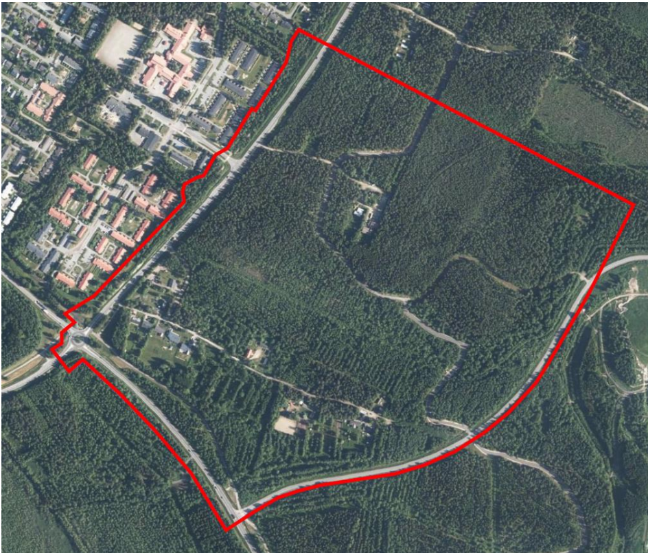
Kuva 2. Ilmakuvaan on rajattu punaisella alue, jolle suunnitellaan uutta asemakaavaa.

Asemakaavan tavoitteena on suunnitella alueen maankäyttöä Uuden Oulun yleiskaavan periaatteiden mukaisesti. Alueelle tavoitellaan monipuolista tonttitarjontaa pientalovaltaiselle asumiselle. Alueelle voi sijoittua omakotitaloja, kytkettyjä pientaloja, rivitaloja ja pienkerrostaloja. Lisäksi alueelle voi sijoittua jonkin verran palvelu- ja työpaikkarakentamista liittyen esimerkiksi urheilu- ja virkistyspalveluihin. Alueelle suunnitellaan toimiva ja tehokas katuverkko, sekä kehitetään alueen viheryhteyksiä ja virkistysmahdollisuuksia huomioiden alueen olevat ja tulevat ulkoilureitit sekä alueen luonto- ja maisema-arvot.