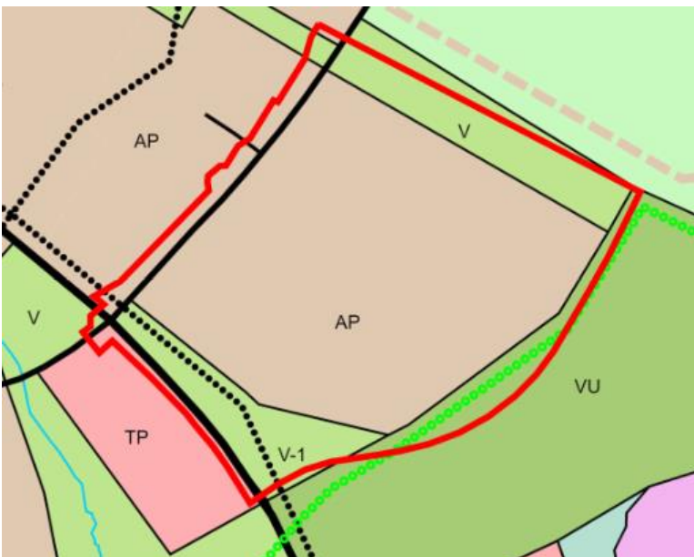
Kuva 3. Yleiskaavakarttaan on rajattu punaisella alue, jolle suunnitellaan uutta asemakaavaa.

Voimassa olevassa Uuden Oulun yleiskaavassa suunnittelualue on osoitettu merkinnällä AP, asuinpientalojen korttelialue. Alue varataan asuinpientaloille, kuten erillispientaloille, kytketyille pientaloille, rivitaloille ja pienkerrostaloille. Alueelle saa lisäksi sijoittaa ympäristöhäiriötä aiheuttamattomia palvelu- ja työpaikkatoimintoja. Alueen pohjois- ja eteläosassa on virkistysalueet (V). Virkistysalueet yhdistyvät viereisen Kuivasjärven kaupunginosan läpi kulkevaan virkistys- ja viherkäytävään sekä suunnittelualueen itäpuolella sijaitsevaan Ruskotunturin urheilu- ja virkistyspalvelujen alueeseen (VU), jonne on osoitettu ohjeellinen ulkoilun pääreitti. Suunnittelualueen eteläpuolella kulkee kevyen liikenteen pääreitti.