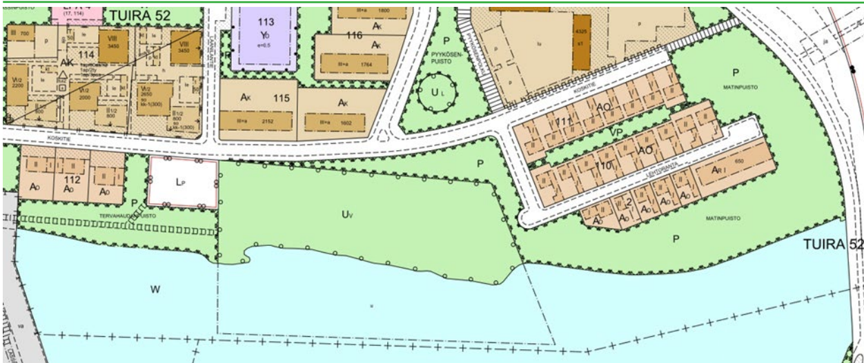
Kuva 4. Ote voimassa olevasta asemakaavasta.