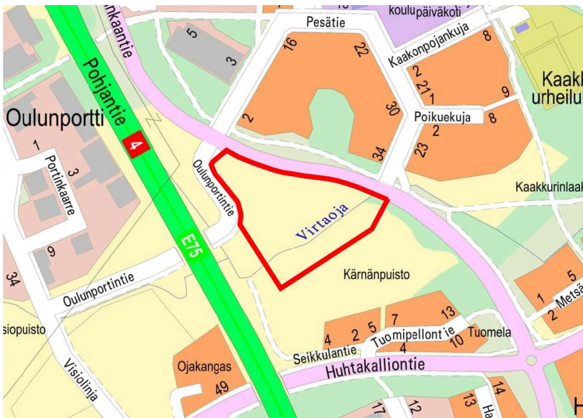
Kuva 1. Kartalle on rajattu punaisella viivalla alue, jolle suunnitellaan asemakaavan muuttamista.

Kaakkurin kaupunginosassa on tullut vireille asemakaavan muutos. Tavoitteena on osoittaa alueelle tontteja työpaikoille ja palveluille. Maankäytön suunnittelussa noudatetaan Uuden Oulun yleiskaavan maankäytön periaatteita sekä hyödynnetään Perävainion ja Kaakkurin kaupunginosien alueille laadittua Oulunportin maankäytön, liikenteen ja ympäristön yleissuunnitelmaa vuodelta 2018. Asemakaava on Oulun maankäytön toteuttamishjelman tavoitteiden mukainen. Tarkoitus on, että asemakaava on vahvistettu vuonna 2026.