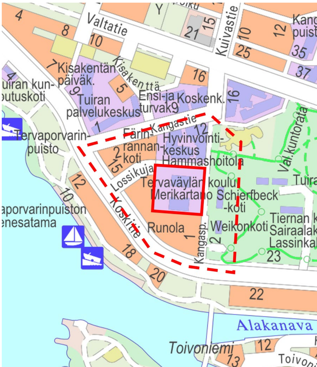
Kuva 1. Kartalle on kuvattu alue, jolle asemakaavan muuttamista suunnitellaan. Asemakaavan muutosalue on rajattu yhtenäisellä punaisella viivalla. Arvioitu lähialue, jolle hankkeella saattaa olla vaikutuksia (tiedotusalue), on rajattu punaisella katkoviivalla.

Tuiran kaupunginosassa, osoitteessa Lossikuja 6, on tullut vireille asemakaavan muutos. Tavoitteena on päivittää suojeltujen rakennusten suojelumerkinnyt, mahdollistaa rakennusten ottaminen asuin-, liike- ja toimistokäyttöön, mahdollistaa uudisrakentaminen tontille sekä tutkia uuden ajoneuvoliittymän mahdollisuutta Lossikujalta. Tavoitteena on, että asemakaavan muutos valmistuu vuoden 2027 aikana.