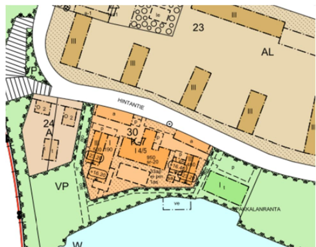
Kuva 2. ote asemakaavasta.