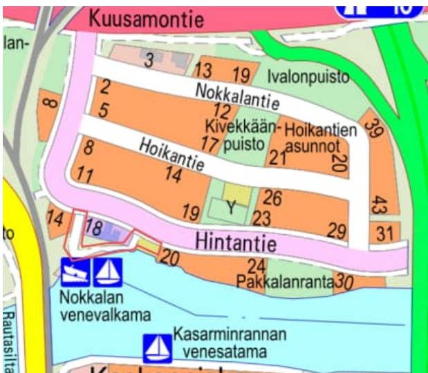
Kuva 1. Suunnittelualue.

Suunnittelualue rajautuu etelässä Oulujokeen, pohjoisessa Hintantiehen, lännestä puistoalueeseen sekä venevajiin ja idästä puistoalueeseen sekä asuinkortteliin. Suunnittelualueen keskellä on liike- ja toimistorakennusten korttelialue Hintantie 18.