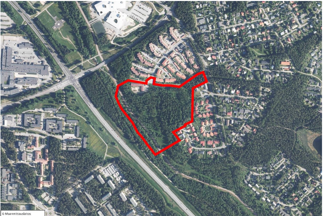
Kuva 2. Ilmakuvaan on rajattu punaisella Svaaninsuon asemakaavan muutosalue.

Asemakaavan muutosalueena on Oulunsuun kaupunginosassa sijaitseva Svaaninsuon alue, jonka pinta-ala on noin 7,8 ha. Alue on pääosin rakentamatonta harvennushakattua metsäaluetta. Alueella sijaitsee päiväkotia. Lähiympäristössä on asumisen korttelialueita omakotitaloista rivitaloihin ja kerrostaloihin. Svaaninsuon asemakaavan muutoksen tavoitteena on alueen käyttötarkoituksen muuttaminen asuinrakentamisen korttelialueiksi sekä virkistysalueeksi.