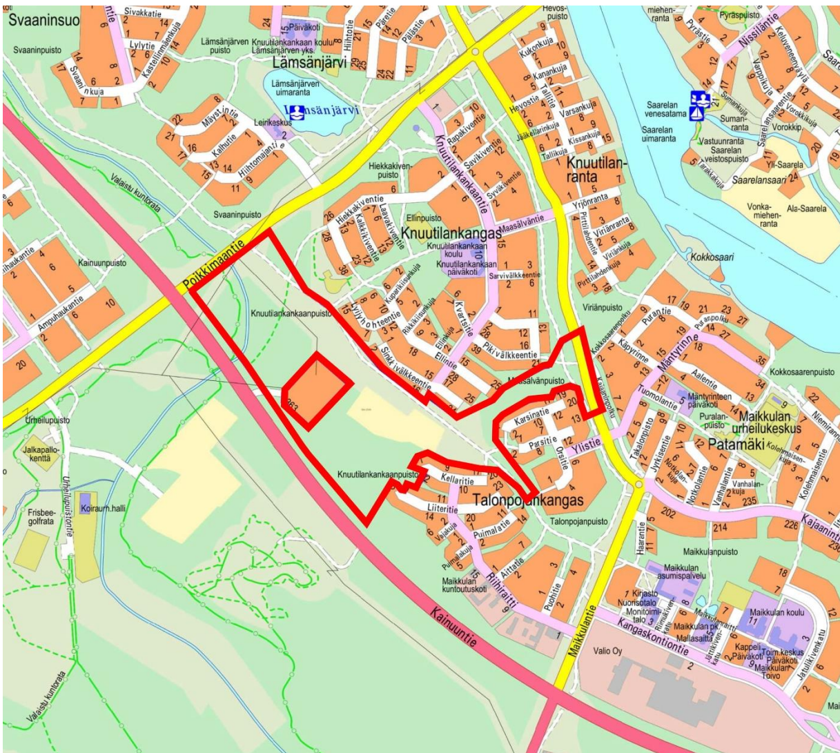
Kuva 1. Opaskartalle on rajattu punaisella Ellinsuon asemakaavan muutosalue.

Knuutilan ja Maikkulan kaupunginosissa sijaitsevan Ellinsuon alueella on käynnissä asemakaavan muutos. Tavoitteena on laatia Ellinsuolle täydentävää asuinrakentamista mahdollistava sekä puisto- ja lähivirkistysalueita sisältävä asemakaava. Ellinsuon maankäytön suunnittelussa noudatetaan Uuden Oulun yleiskaavan maankäytön periaatteita sekä hyödynnetään Maikkulan alueelle laadittua täydennysrakentamisen tavoitesuunnitelmaa vuodelta 2019. Tarkoituksena on, että Ellinsuon asemakaava on vahvistettu alkuvuonna 2025.