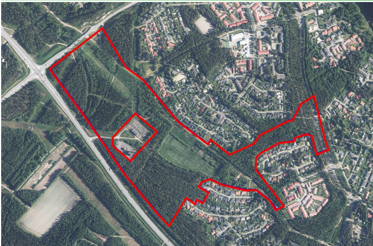
Kuva 2. Ilmakuvaan on rajattu punaisella Ellinsuon asemakaavan muutosalue.