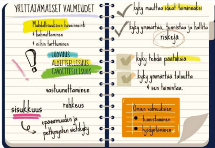
Kuva 1: Yrittäjämäiset valmiudet (OPH, 2024)