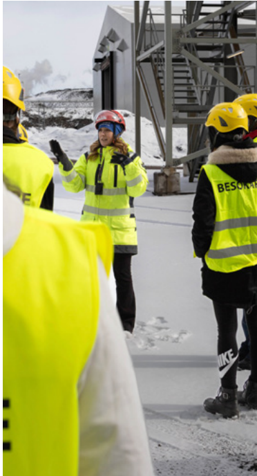
Kuva 3. Laaja-alainen osaaminen lukiossa (OPH)

Vaihtoehtoisia osaamislistauksia on olemassa useita, eivätkä tulevaisuuden työelämätaidot taivu kovinkaan helposti vain yhdenlaiseksi malliksi. Selkeyttä luodakseen NYT on tehnyt yhteistyötä eri organisaatioiden kanssa ja hyödyntänyt sekä EntreComp -viitekehystä että elinikäisen oppimisen avaintaitoja , joiden pohjalta he ovat laatineet yhdenlaisen tulkinnan työelämätaidoista ( Nuorten yrittäjyys ja talous NYT 2020 ). NYT:n tulkinnan pohjalta olemme luoneet tätä opasta varten havaintokuvan (kuva 4), jota voi käyttää lähtökohtana yrittäjyyskasvatusta suunniteltaessa. EntreComp -viitekehysten tapaan se rakentuu kolmesta osa-alueesta ( sisäinen kasvu, toimintaympäristön halluunotto ja toiminnan käynnistäminen ), jotka sisältävät yhdeksän keskeistä työelämätaitoa. Sisällyttämällä näitä taitoja opetukseen, päästään toteuttamaan yrittäjyyskasvatuksen tavoitteita.