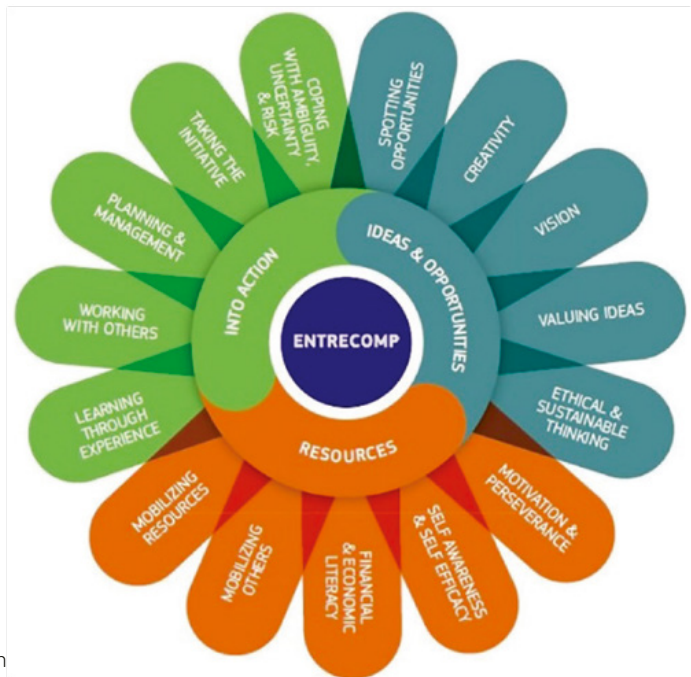
Kuva 2. Eurooppalaisen yrittäjyysosaamisen viitekehys. (European Union, 2018)

Mikäli EntreComp viitekehykseen perehtyy tarkemmin, sen muodostamien temaattisten ketjujen ja osaamistasojen kautta voi päästä 442 mahdolliseen oppimistulokseen ( tutustu Entrecomp pelikirjaan ). Entrecomin avulla voidaan luoda oppimisympäristöjä ja edistää oppimista, joissa huomioidaan, että kehittäminen lähtee luovuudesta. Sen lähtökohdana on, että sosiaalisen, kulttuurisen ja taloudellisen innovoinnin perusedellytys on asioiden kehittäminen yhteistyössä. Yrittäjyys (yritteliäisyys) nähdään tärkeänä, muille arvoa luova prosessina, jonka toteuttamisessa tarvitaan tietyn tyyppistä kansalaisvaikuttamista. Tulokset voivatkin poiketa merkittävästi perinteisestä, taloudellista hyötyä painottavasta yrittäjyysnäkemyksestä, ja painottaa sosiaalista tai kulttuurista arvoa. (Entrecomp 360, s.4.)