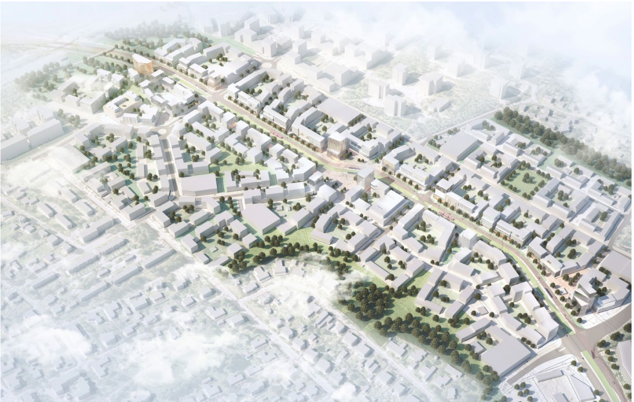
Kuva 3. Kemintien kaavarunko. Viistoilmakuva koillisesta. Kaavamuutosalue on kuvan vasemmassa reunassa.