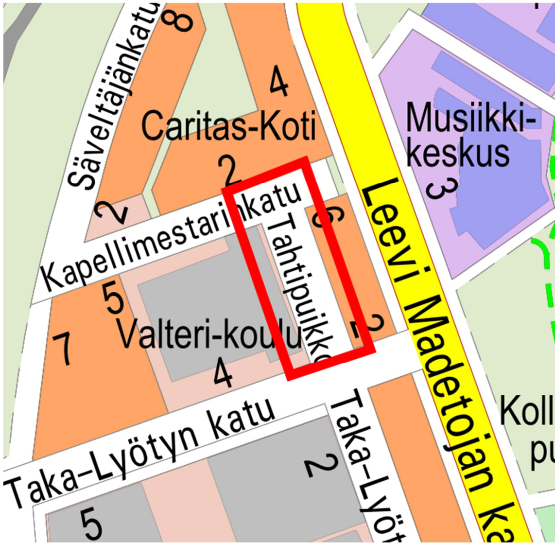
Kuva 1. Suunnittelualueen rajaus opaskartalla.