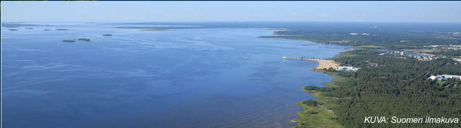
KUVA: Suomen ilmakuva

Yhteistyöstä sopiminen ja aikataulun täsmentäminen 2021 >