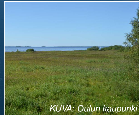
KUVA: Oulun kaupunki