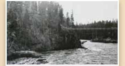
Pyhäkoski, peruskallion reuna. Pyhäkoski and the edge of the bedrock. Fortum Oyj

Jokilaakso edustaa Pohjois-Pohjanmaan joki- ja rannikkoseudun maisemallisesti arvokasta maatalouden muokkaamaa kulttuurimaisemaa. Muhos- ja Poikajoen syvät kanjonit ja Muhos-muodostuma kuuluvat alueen erityispiirteisiin. Jäätikkötoiminta ja hautavajoama ovat muokanneet laakson sellaiseksi kuin se nykyään on.