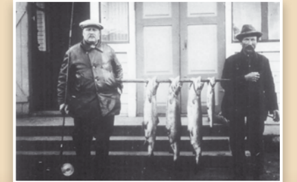
Lohisaalis. Salmon catch. Muhoksen kunta

Oulujoen vaarallisia koskia laskivat työkseen erityiset laskumiehet, jotka olivat harjaantuneita koskenlaskijoita. Suurilla koskilla laskumiehiä tarvittiin tämän tästä. Paikalliset kalastajat toimivat myös lohimatkailijoiden soutajina, kun englantilaiset ja aasialaiset turistit tulivat narraamaan Oulujoen kuuluisia lohia.