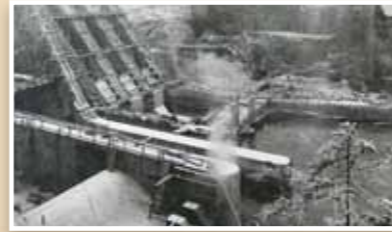
Oulujoen valjastaminen. The harnessing of Oulujoki River. Fortum Oyj

Oulujoki on yksi maailman säännöstellyimmistä joista. Oulujoen suuret kosket valjastettiin tehokkaasti sähköntuotantoon, jonka seurauksena jokilaakson maisema ja esimerkiksi Utajärven keskustan maisema kävi läpi perusteellisen muodonmuutoksen.