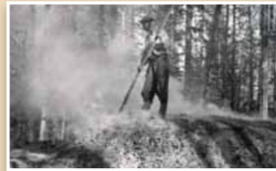
Tervan poltto, lotnikka. The pit master at work. Kainuun museo

1800-luvulla Kainuu ja Oulujärven ympäristö oli pääasiallinen tervantuotantoalue Suomessa. Tervaksia saatiin mäntymetsiä koloamalla ja tervaa poltettiin haudoissa ympäri metsiä. Tervahautoja on vieläkin näkyvissä mm. Rokuaalla.