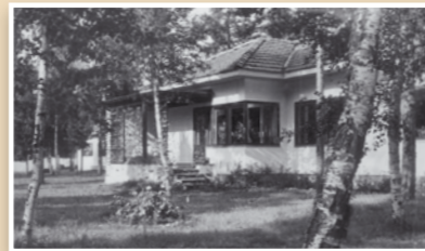
Leppiniemen asuinalue Muhoksella. Leppiniemi residential area in Muhos. Fortum Oyj

Oulujokilaakson kulttuurihenkilöihin lukeutuu mm. voimalaitosarkkitehti Aarne Ervi. Muhoksen maisemissa sijaitsee Ervin suunnittelema kuuluisa Montan voimalaitos ja Leppiniemen asuinalue, joihin pääsee tutustumaan Tervareitistön varrella.